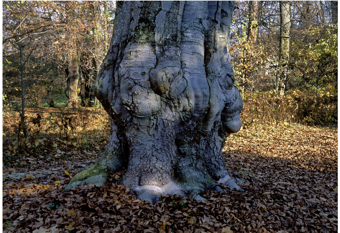
Blutbuche Schlosspark Affing

Der Himmel, das Wolkenspiel, Baumkronen und Baumstämme laden ihren Betrachter fast reflexartig zu einem Suchbild für Charaktere und Figuren ein. Elementen der Natur werden wie selbstverständlich Adjektive zugeordnet. Gleiches gilt interessanterweise für abstrakte Kunstwerke. Unbewegliche Dinge werden so mit Leben und Dynamik beseelt. Der Skulpturengarten entsteht im Kopf des Besuchers und ist einmal mehr eine unwiederbringliche Momentaufnahme des individuellen Gefühls.