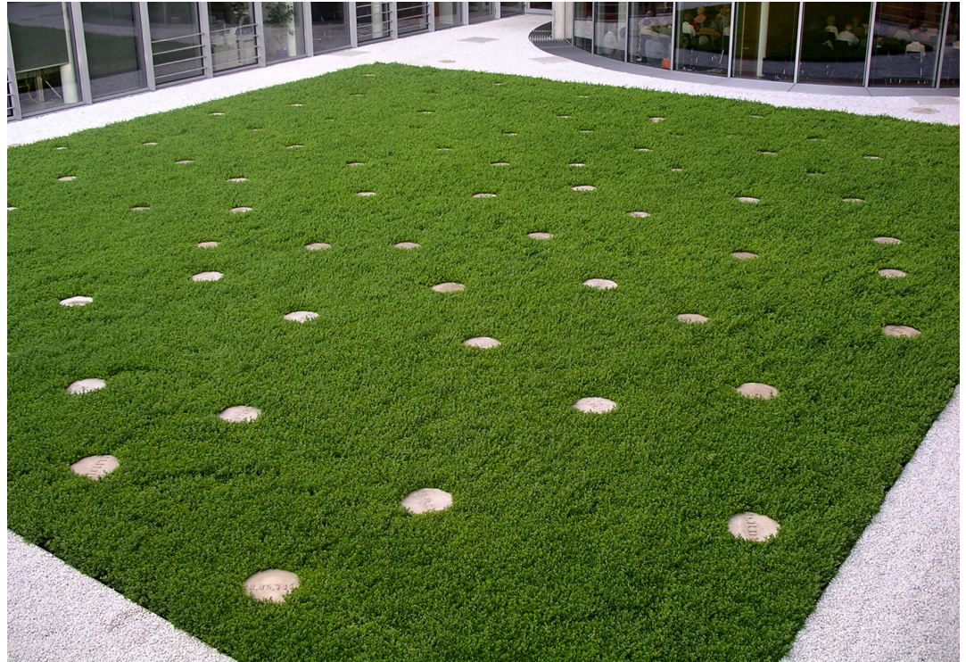
Bundestag Berlin, Tiefhöfe Paul-Löbe-Haus

Die Höfe im Bundestag wurden abgesenkt. Dies war ein Kniff des Architekten, um das Untergeschoss mit Tageslicht zu versorgen. Vom Straßenniveau sieht man hinunter auf die Höfe. Oft sind solche abgesenkten Tiefhöfe eher triste Zweckräume. Der Dialog der Landschaftsarchitektur mit verschiedenen Kunstobjekten läßt diese Zweckräume zu Orten mit eigener Gestaltungsaussage und Atmosphäre werden.